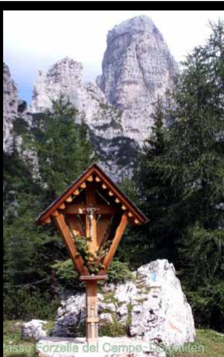
Massa Forzella del Campo - Dolomiten

Sonnige, leuchtende Tage, nicht weinen, dass sie vergangen, lächeln, weil sie gewesen. Konkretus